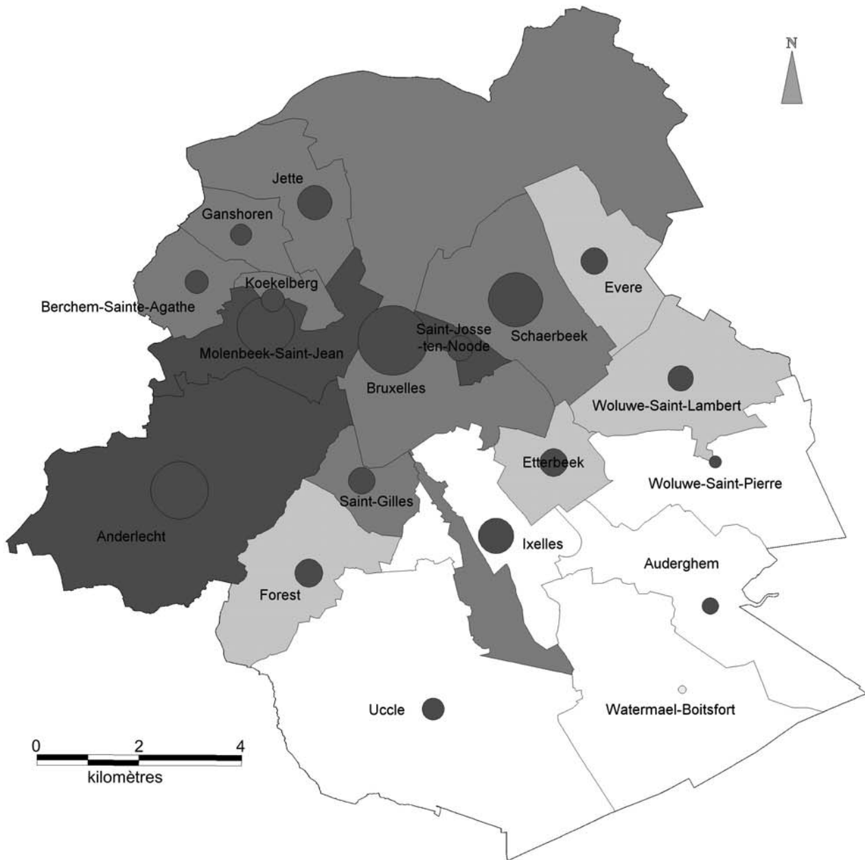
Carte IV.1.1 : Écart de croissance annuelle moyenne de la population par rapport à la Région, période 2010-2020

Écart de croissance annuelle moyenne p/r à la Région 2010-2020